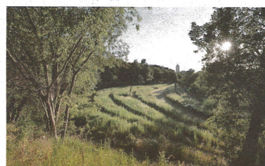
© EMF Estudi Martí Franch Arquitectura del Paisatge